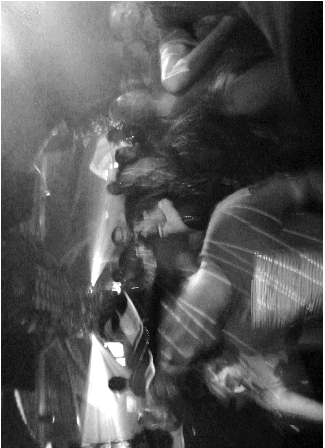
MIND THE NIGHT: LES NUITS DE DEMAIN