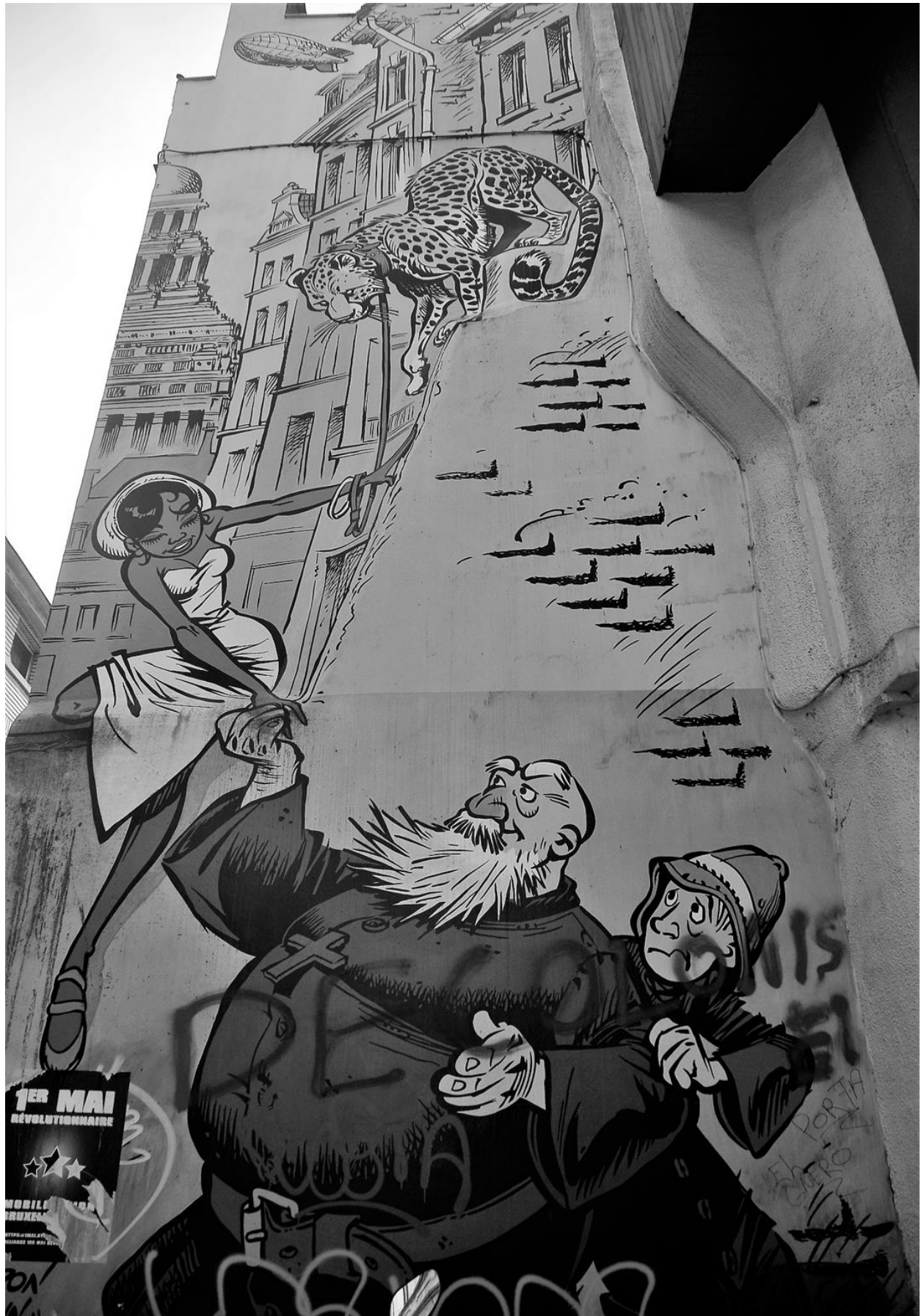
CONTESTED SYMBOLS IN PUBLIC SPACE