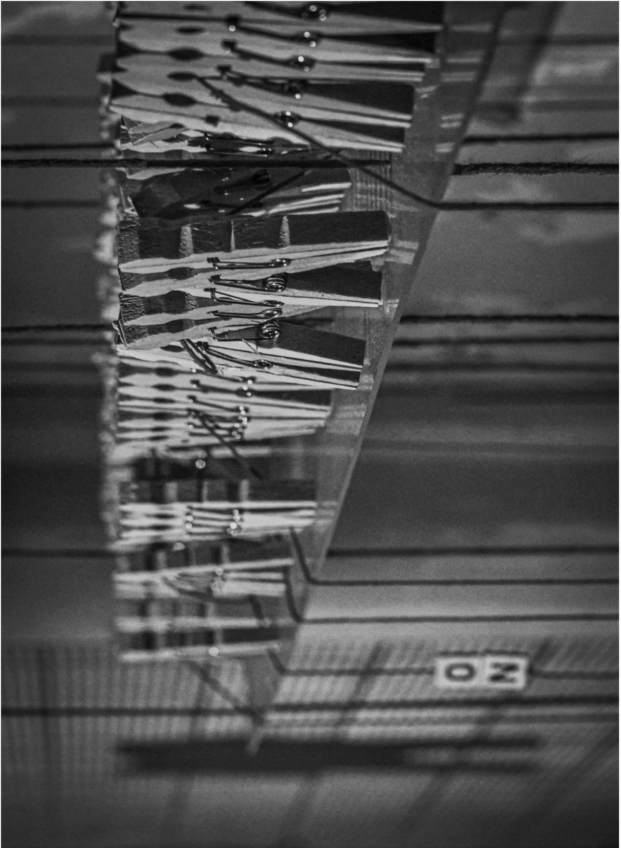
JUS SANGUINIS