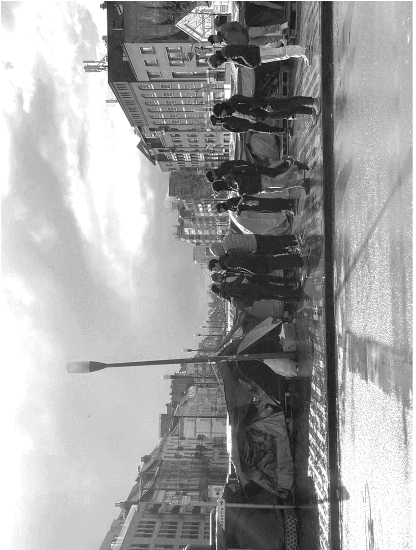
BRIDGE STORIES