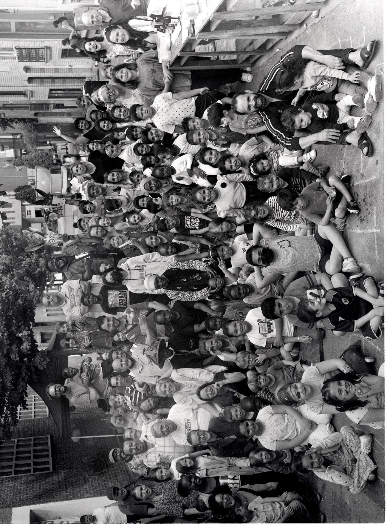
ARPENTAGE D'UN QUARTIER POPULAIRE