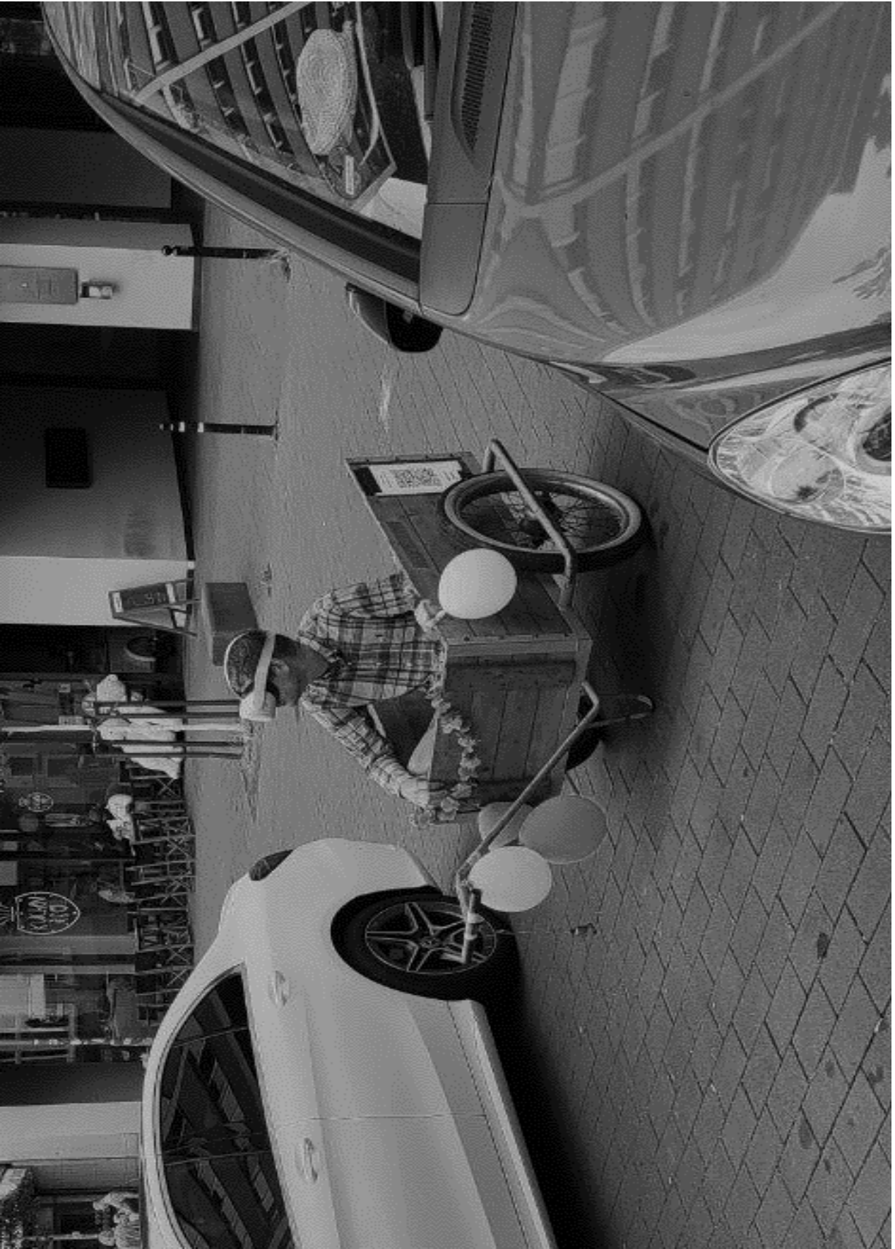
1984 IS NOW