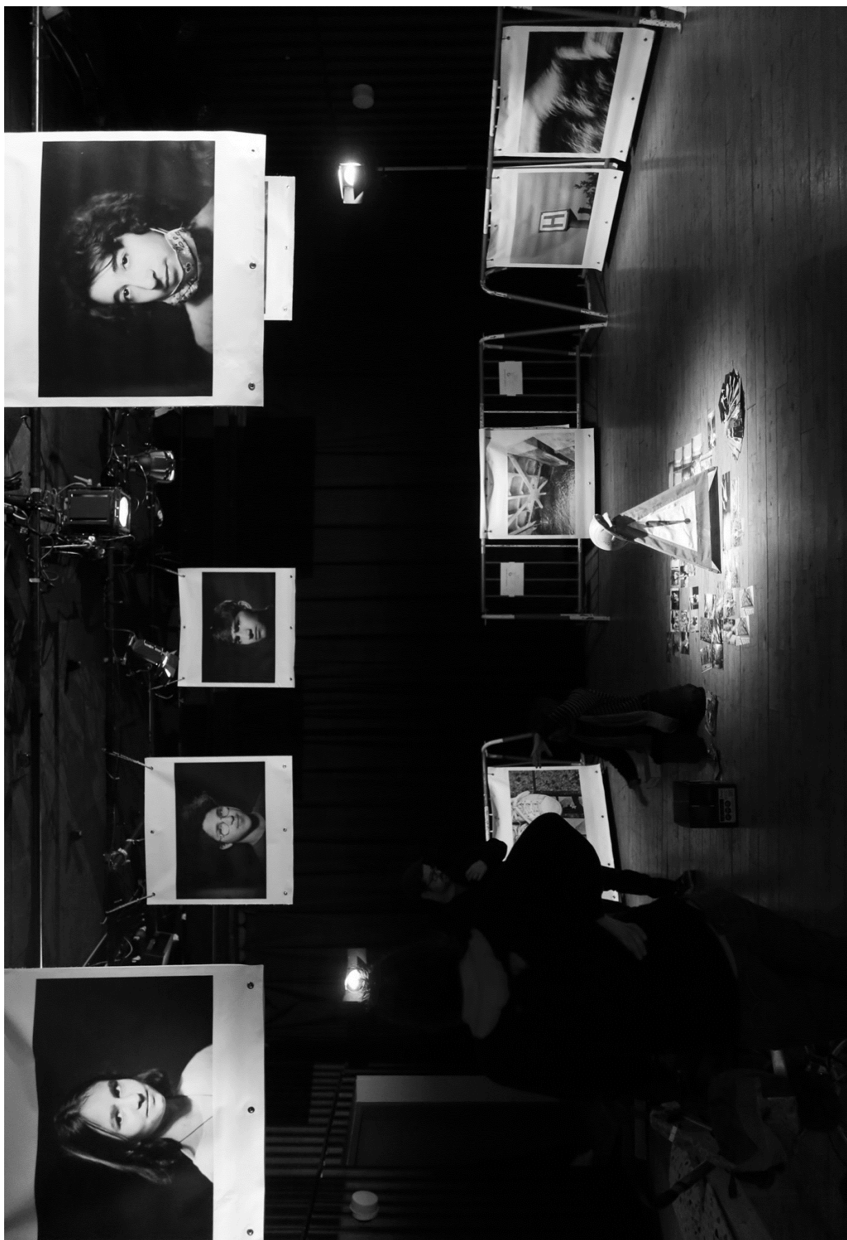
URBE URBANISME EMOTIONNEL